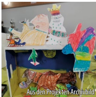
Aus den Projekten Archivbild